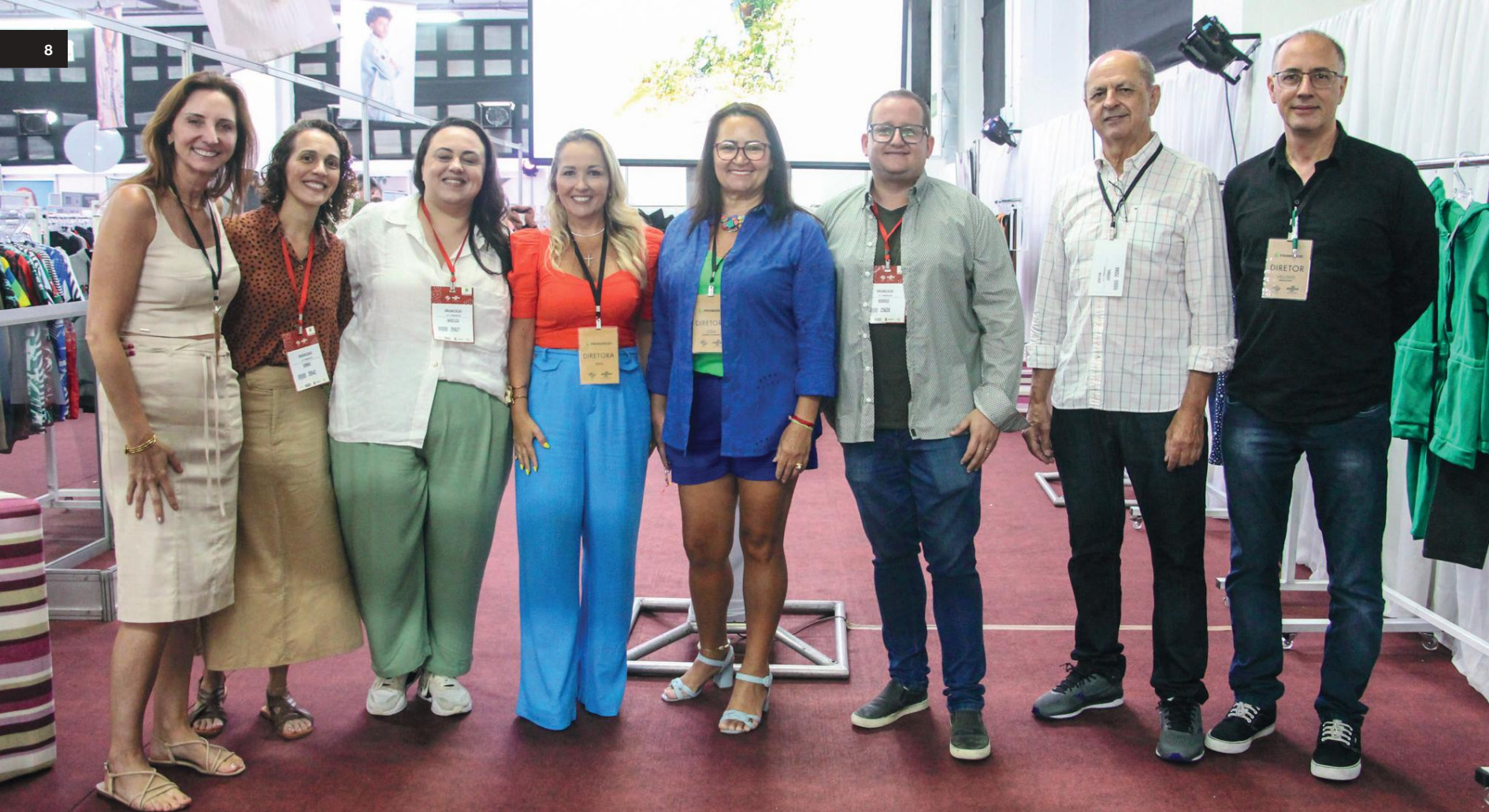
Diretores da AmpeBr com representantes do Senai, na Sala Sensorial, durante a 61ª Pronegócio