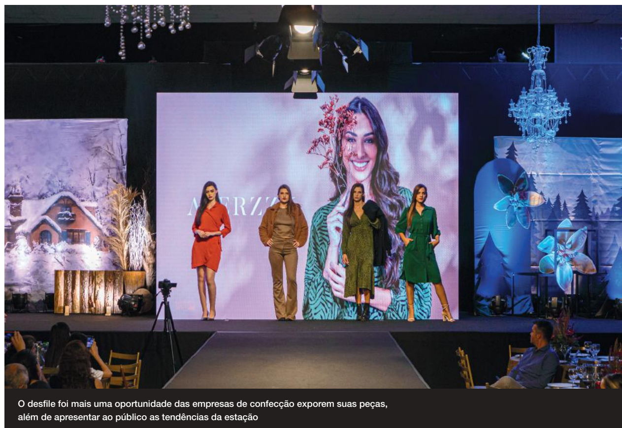
O desfile foi mais uma oportunidade das empresas de confecção exporem suas peças, além de apresentar ao público as tendências da estação

"Inverno com sentimento, proteção e aconchego" foi o tema do desfile produzido pela Agência Lucky 70. Ao todo, foram apresentados cem looks de 25 empresas participantes, com as princi-