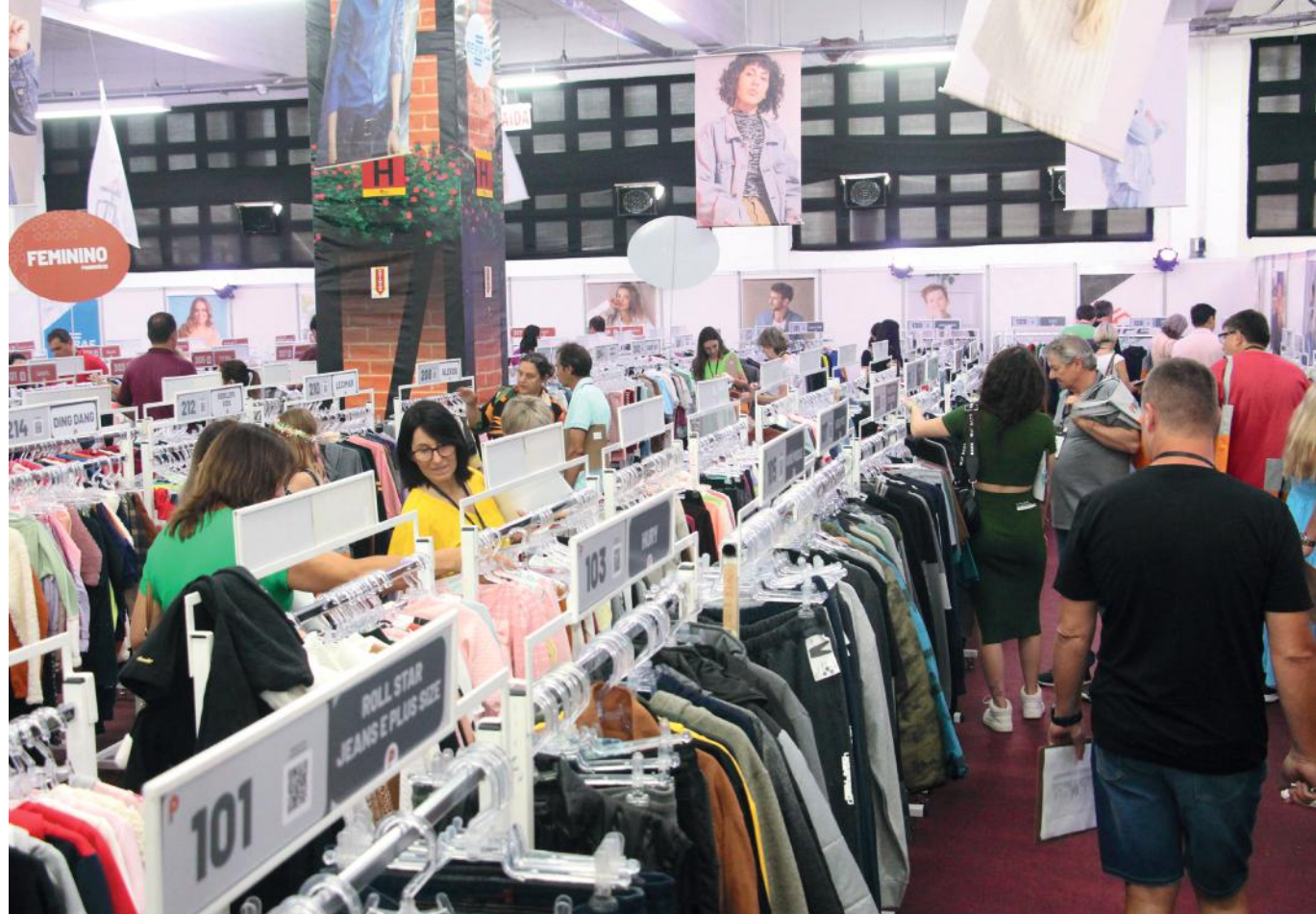
O evento registrou aproximadamente 30% de aumento nas vendas, comparado à rodada do mesmo período, em 2022

Segundo ela, o volume de negociações foi tão intenso que foi preciso atrasar o início do Desfile de Moda, realizado