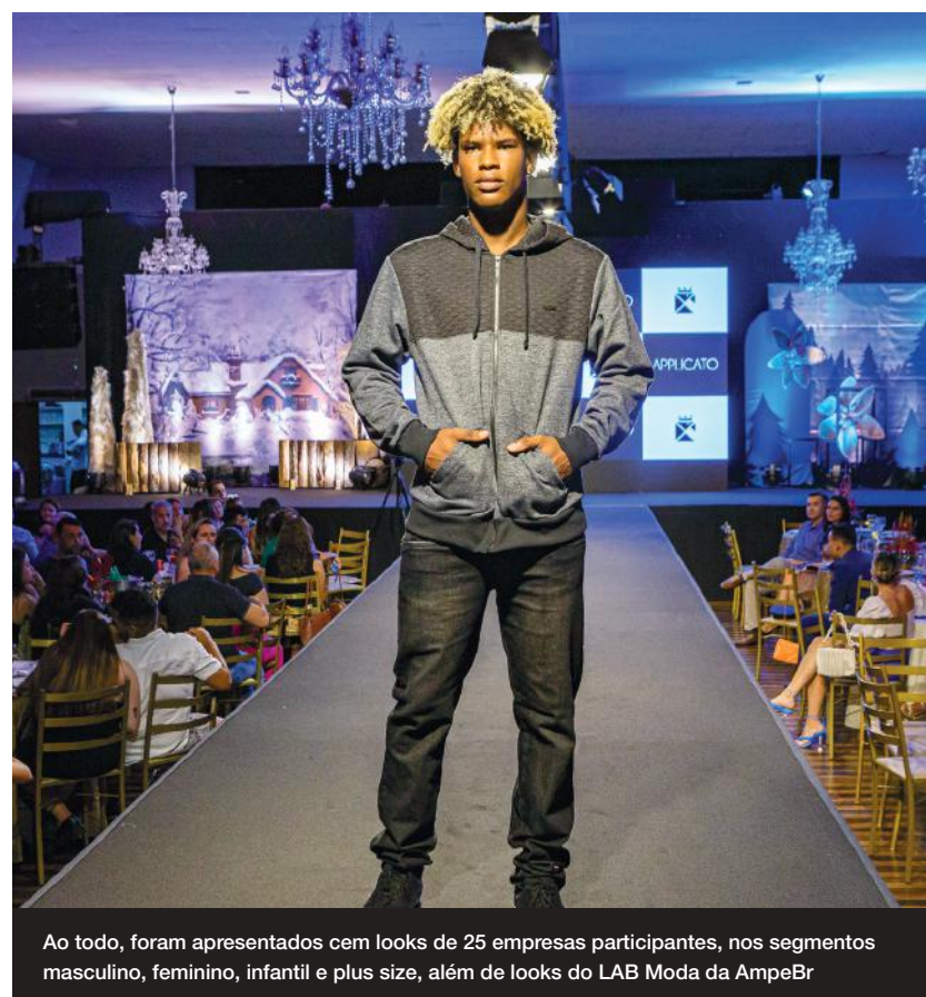
Ao todo, foram apresentados cem looks de 25 empresas participantes, nos segmentos masculino, feminino, infantil e plus size, além de looks do LAB Moda da AmpeBr