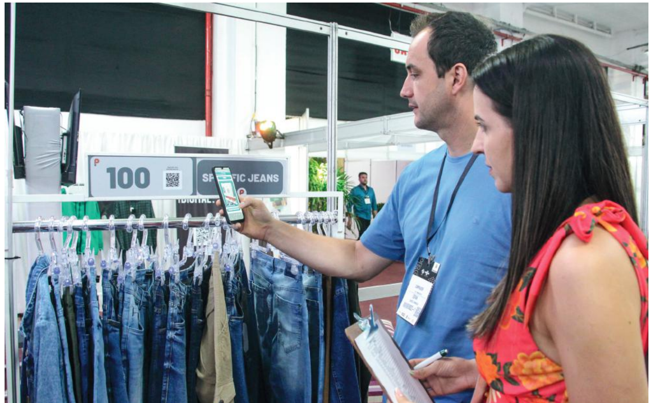
O QR Code para agendamento no showroom foi uma das novidades desta edição e trouxe mais agilidade e autonomia aos compradores

Para ela, que possui uma rede de 35 lojas, nos estados de Minas Gerais e São Paulo, a rodada superou as expectativas. Segundo Pollyana, o desfile, realizado na terça-feira, influenciou muito na